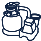
Groupe de filtration YZAKI 8,3 m 3 /h